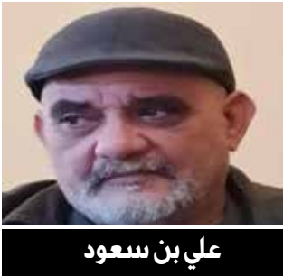
علي بن سعود