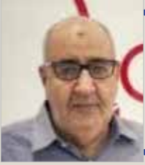
بقلم ... خليفة بن مرتيتي

كرة القدم لعبة جماعية، تتحقق نتائجها الإيجابية بجهود كل لاعبي الفريق، صحيح أن هناك نجوم مميزين يقع عليهم العبء الأكبر في تحقيق النتائج والبطولات، ولهذا تجدهم باستمرار في صدارة وسائل الإعلام الرياضية، لكن يفترض ألا ننسى الآخرين الذين أعطوا كل حسب إمكانياته، وساهموا في انتصارات الفريق، ومن هؤلاء لاعبينا الذي ودع الحياة وهو في ريعان شبابه، وكان محل إعجاب واحترام الكثيرين، لما قدمه من إبداعات فنية وتربوية.